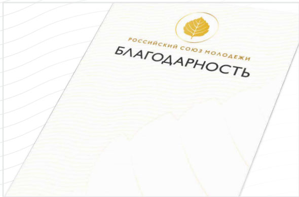
Благодарность Председателя РСМ