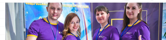
Федеральный проект «Пространство развития»