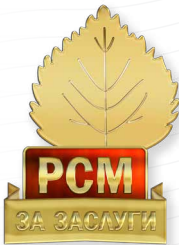
Знак «За заслуги» I степени