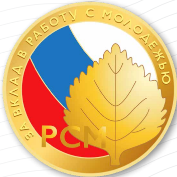
Медаль РСМ «За вклад в работу с молодежью»