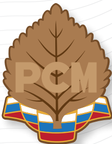
Почетное звание «Почетный член РСМ»

На Пленуме ЦК РСМ в г. Казань Республики Татарстан впервые вручили Медаль РСМ «За вклад в работу с молодежью»