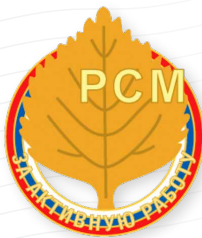
Знак «За активную работу в РСМ»