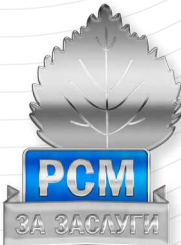
Знак «За заслуги» II степени