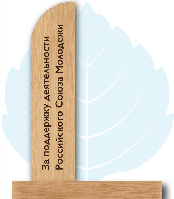
Знак «За поддержку деятельности РСМ»