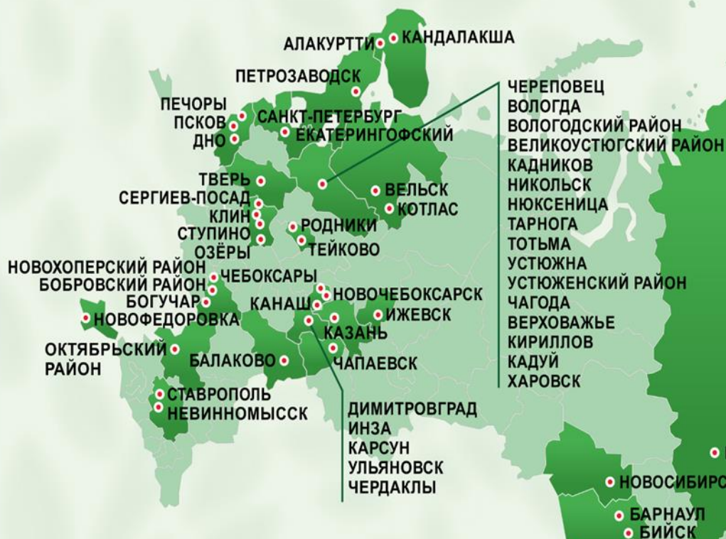
Динамика численности городов- членов Ассоциации

ЦЕЛЬ: объединение усилий и ресурсов для создания условий улучшения здоровья и качества жизни населения в российских городах, районах и посёлках