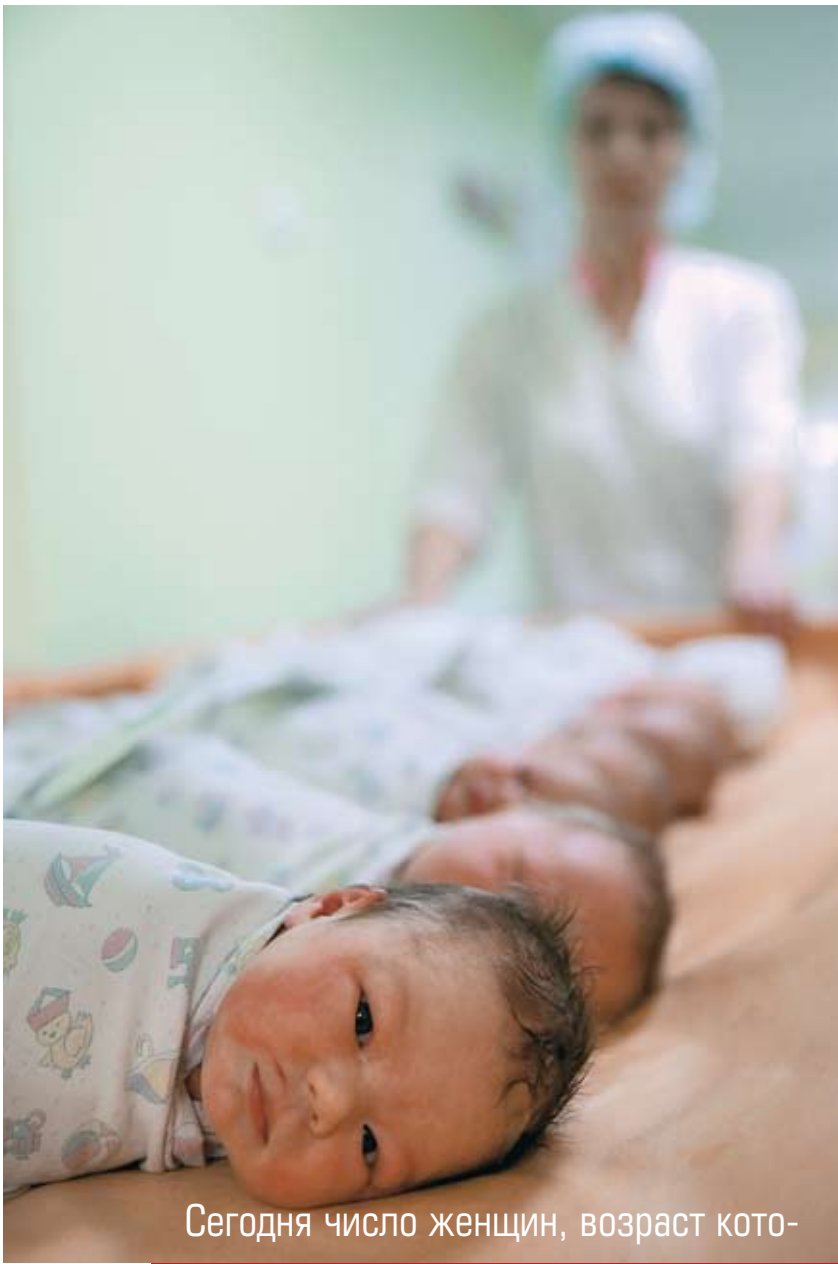
Сегодня число женщин, возраст кото-

В итоге, по нашим оценкам, материнский капитал, вложенный в улучшение жилищных условий, окупается в течение пяти лет. Но, к сожалению, в наших управленческих шаблонах защита нехитрая мысль: все, что уходит на демографическую политику, — это безвозвратные расходы. Но они быстро возвращаются обратно. Просто на уровне управления демографией нужно перейти от философии бухгалтера к философии инвестора. И все заработает как надо.