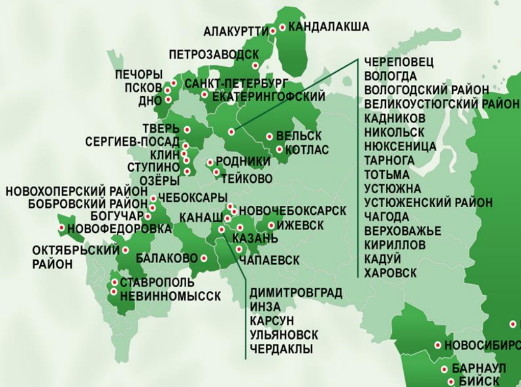
Динамика численности городов- членов Ассоциации

ЦЕЛЬ: объединение усилий и ресурсов для создания условий улучшения здоровья и качества жизни населения в российских городах, районах и посёлках