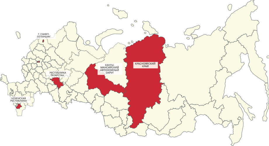
Динамика показателей передачи СО НКО услуг населению в сфере физической культуры и спорта