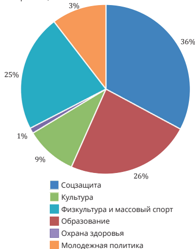
Рисунок 1. Общий объем средств бюджетов субъектов Российской Федерации, фактически переданных СО НКО на оказание услуг по отраслям, %

Информация приведена по 83 субъектам, за исключением Ульяновской области и Республики Хакасия.