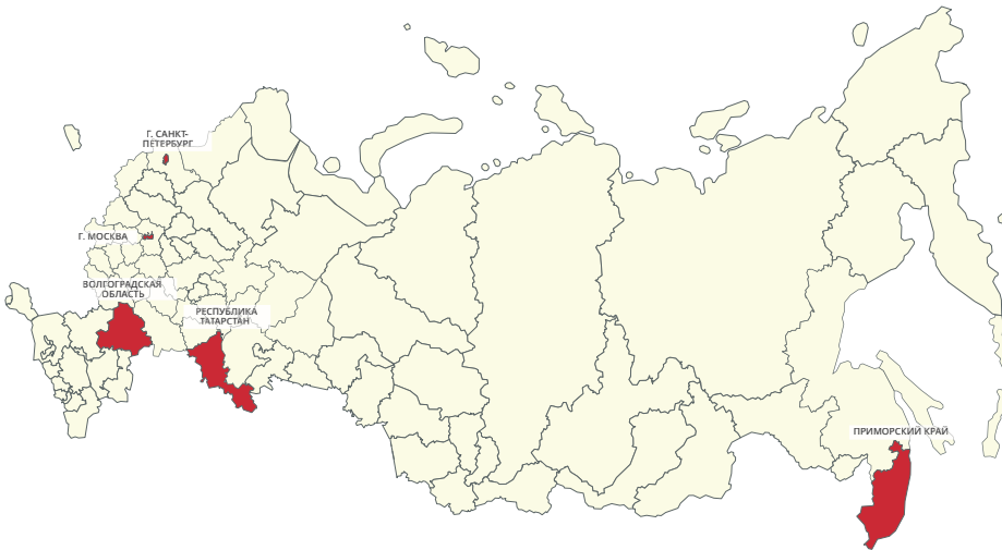
Динамика показателей передачи СО НКО услуг населению в сфере молодежной политики